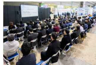
※前回セミナー会場風景